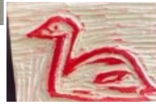
↑杣江の森の間伐材を使って作成したスタンプ 学校に隣接する与兵衛沼に飛来する白鳥を象っている