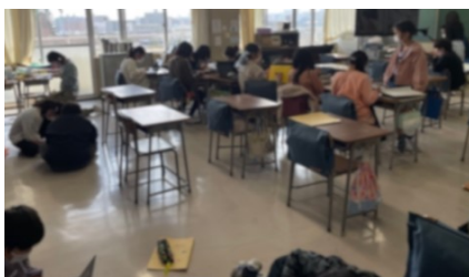
解決方法の実践の様子