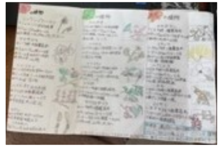
↑「杣江の森の植物」をまとめたリーフレット