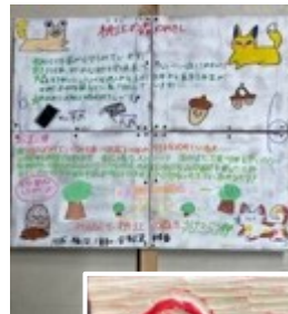
←「杣江の森の歴史と自然」に関する看板