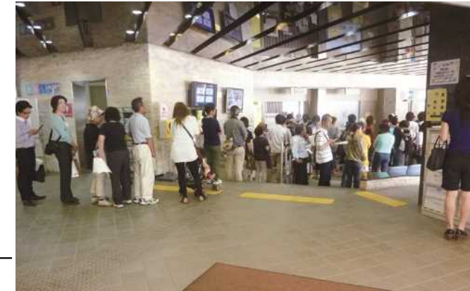
り災証明申請手続きを待つ市民 (H23.6 宮城野区役所)