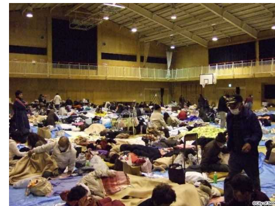
避難所の様子 (H23. 3. 13宮城野区榴岡小学校)