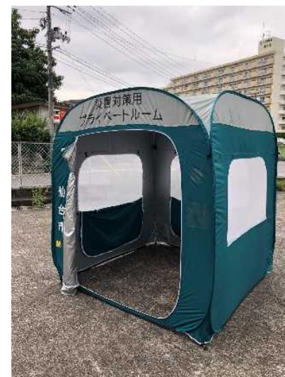
テント式プライベートルーム (拡充された備蓄品)